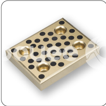
●运动方向为纵横两方向

请从适用的长度、宽度、厚度中选择零件号 (例)内径25mm、外径33mm、长度20mm的情况下